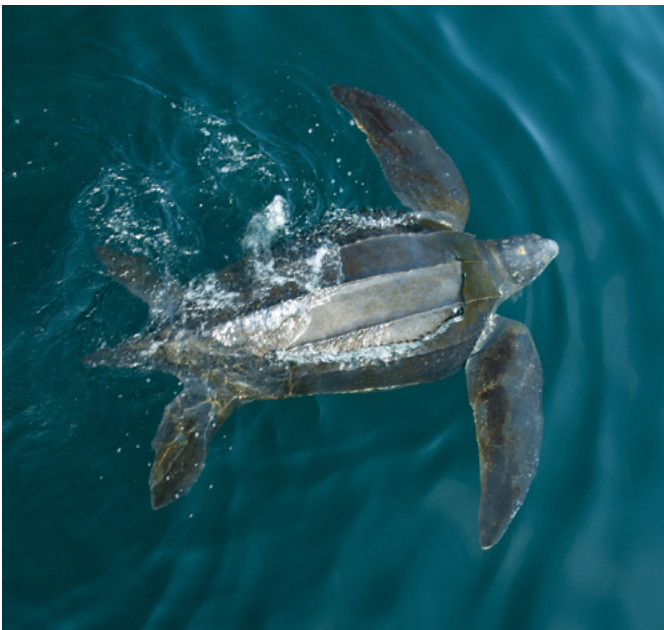
Tortue luth

Canadian Sea Turtle Network 1-888-729-4667 (sans frais) info@seaturtle.ca