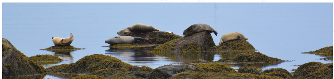
Observation de phoques communs au parc national du Bic