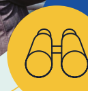
Observation à partir d'un traversier

N'oubliez pas d'apporter des jumelles pour une meilleure observation depuis la rive et des traversiers!