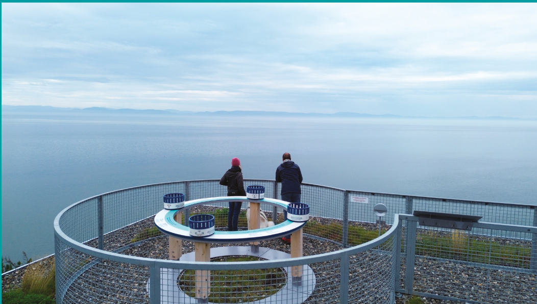
Observatoire Putep 't-awt de la Première Nation Wolastoqiyik Wamspekwik @ ROMM

Vous trouverez aussi des centres d'interprétation et des observatoires où des activités guidées permettent d'en apprendre davantage sur les espèces et leur habitat.