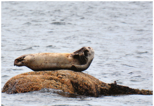
Phoque commun