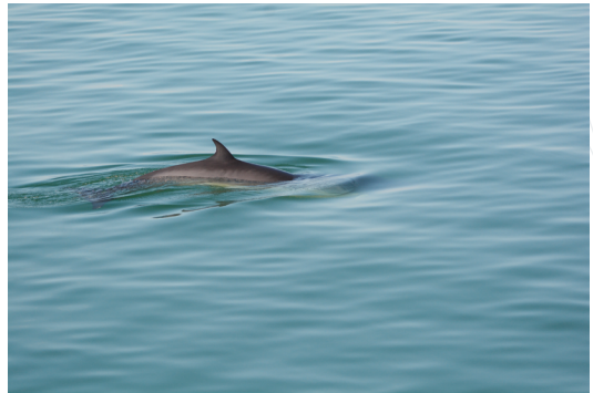
Petit rorqual