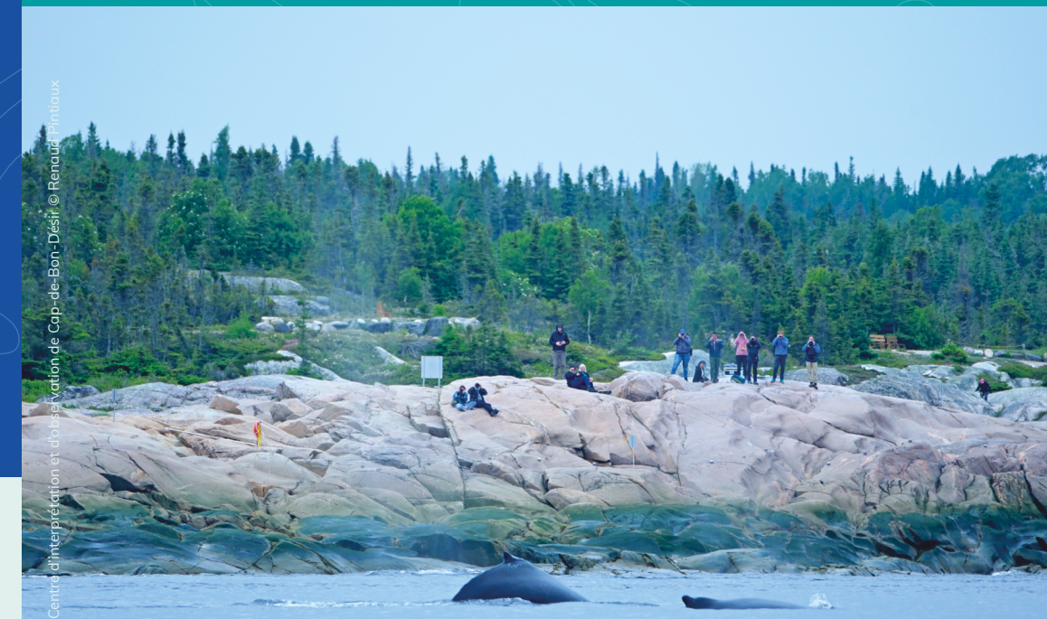
Centre d'interprétation et d'observation de Cap-de-Bon-Désir

Prenez le temps d'observer les baleines et les phoques depuis la rive ou des traversiers. C'est une façon privilégiée de vivre un moment inoubliable, tout en respectant leur tranquillité.