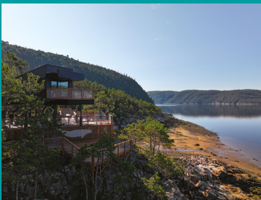
Halte du béluga à la Baie-Sainte-Marguerite